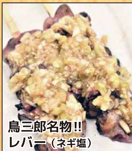
鳥三郎名物!! レバー (ネギ塩)