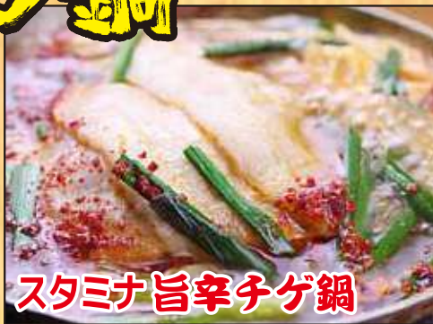
スタミナ旨辛チゲ鍋