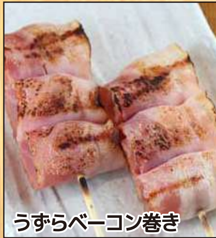
うずらベーコン巻き