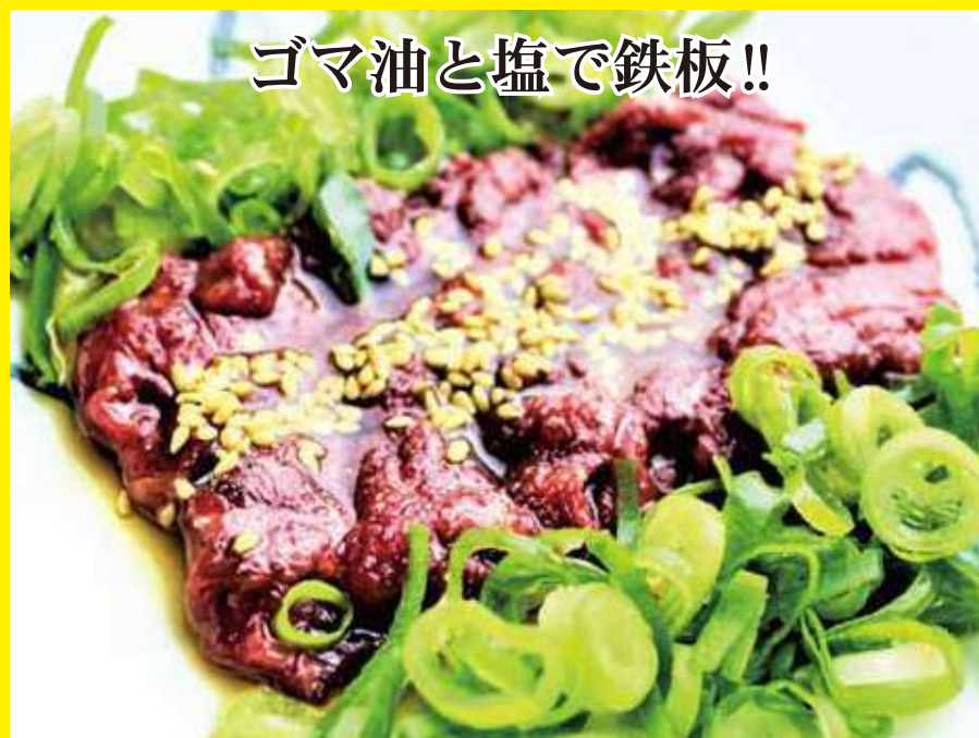
ゴマ油と塩で鉄板!! 塩ユッケ [1人前] 560 円(税込み616円)