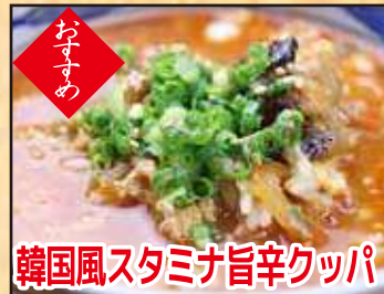
韓国風スタミナ旨辛クッパ