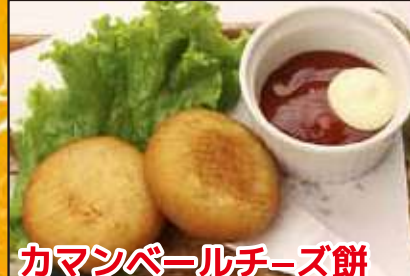
カマンベールチーズ餅