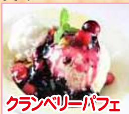
クランベリーパフェ