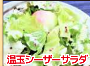
温玉シーザーサラダ