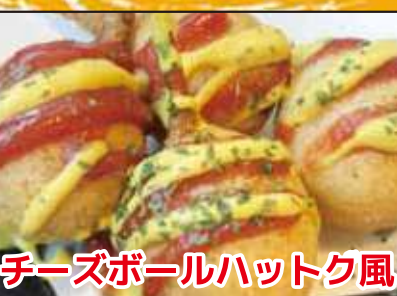
チーズボールハットク風