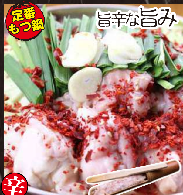
定番もつ鍋 旨辛な旨み 辛 生つくね&濃厚辛もつ鍋 [1人前] 560 円(税込み616円)