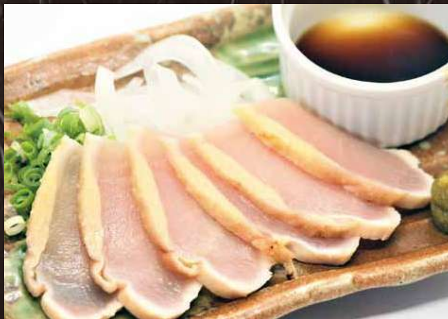
さつま知覧鶏たたき(ポン酢) [1人前] 280 円(税込み308円)