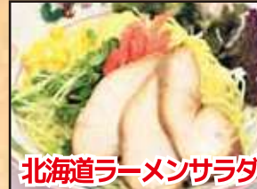
北海道ラーメンサラダ