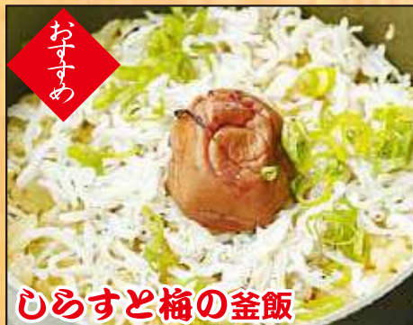
ひめすと梅の釜飯