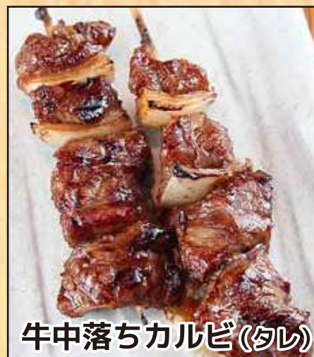
牛中落ちカルビ (タレ)