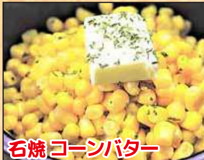
石焼コーンバター