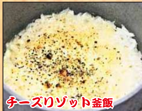
チーズリゾット釜飯