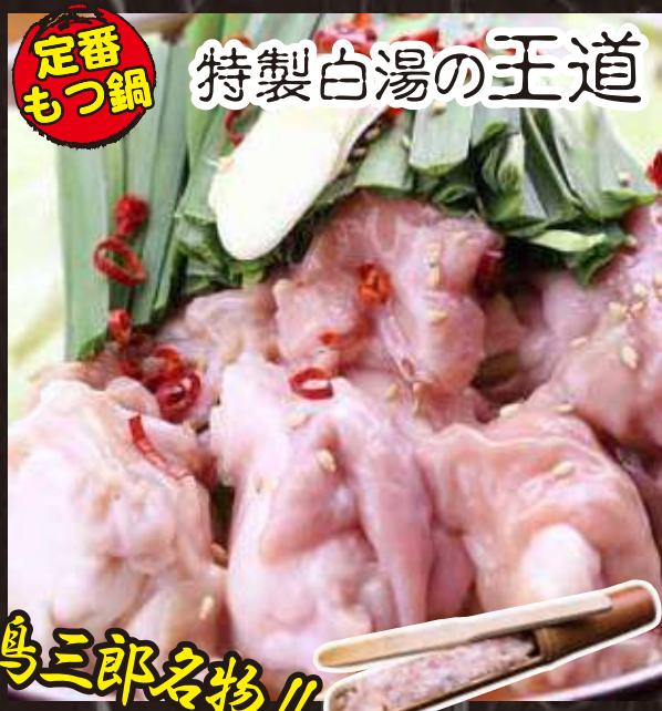
定番もつ鍋 特製白湯の王道 鳥三郎名物!! 生つくね&牛もつ鍋 [1人前] 560 円(税込み616円)