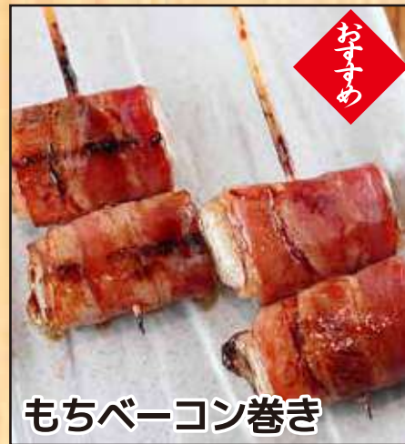
もちベーコン巻き