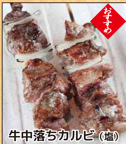
牛中落ちカルビ (塩)