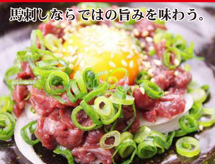
馬刺しならではの旨みを味わう。 馬刺ユッケ [1人前] 560 円(税込み616円)