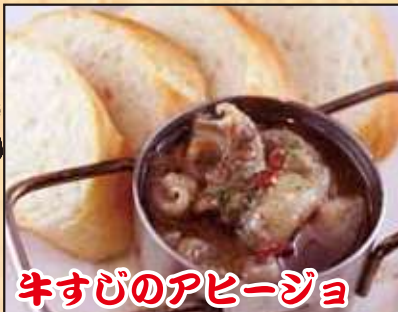
牛すじのアヒージョ