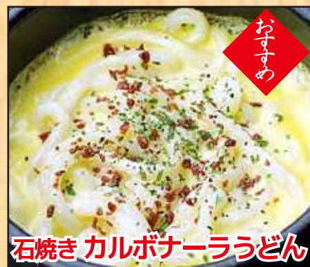
石焼きカルボナーラうどん