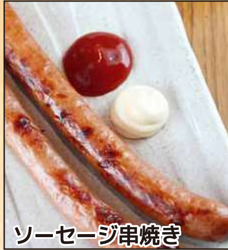
ソーセージ串焼き