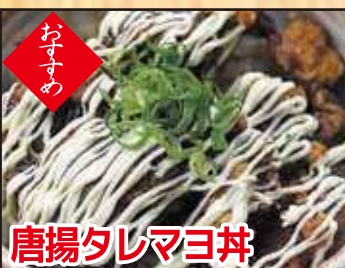
唐揚げタレマヨ丼