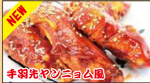
NEW 手羽先やしんヨム風