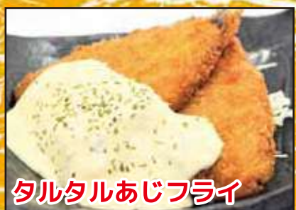
タルタルあじフライ