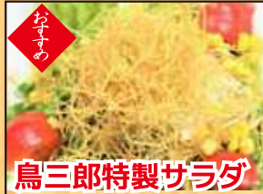
鳥三郎特製サラダ