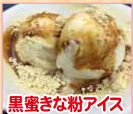
黒蜜きな粉アイス