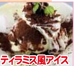
ティラミス風アイス