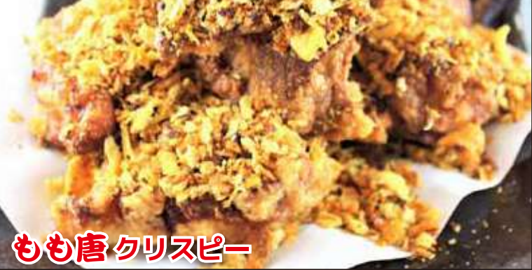
もも唐 クリスピー