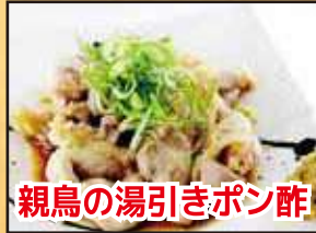
親鳥の湯引きポン酢