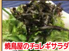
焼鳥屋のチレギサラダ