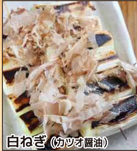
白ねぎ (カツオ醤油)