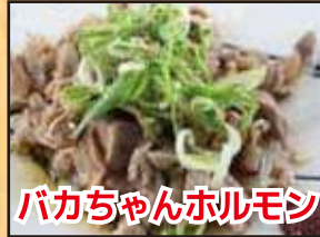
バカちゃんホルモン