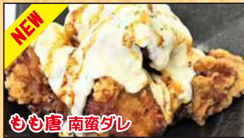
NEW もも唐 南蛮ダレ