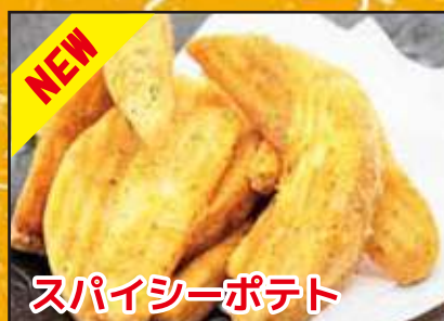
NEW スパイシーポテト