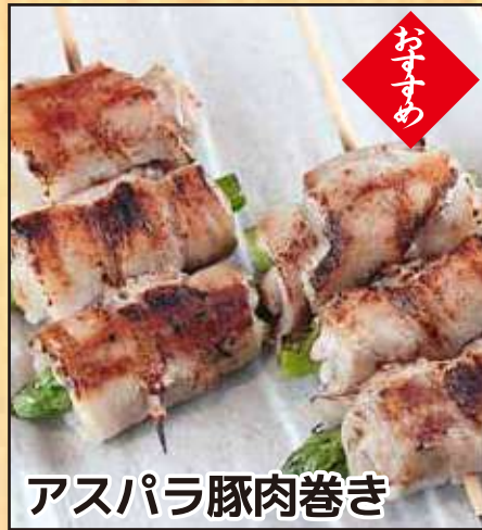
アスパラ豚肉巻き