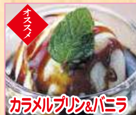
カラメルプリン&バニラ