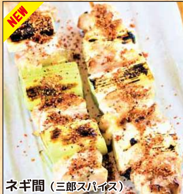
ネギ間 (三郎スパイス)