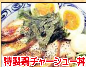
特製鶏チャーシュー丼