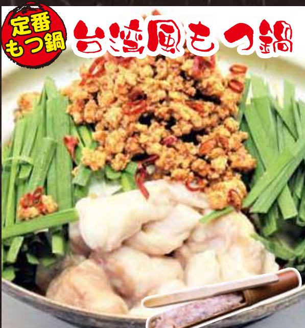
定番もつ鍋 台湾風もつ鍋 [1人前] 560 円(税込み616円)