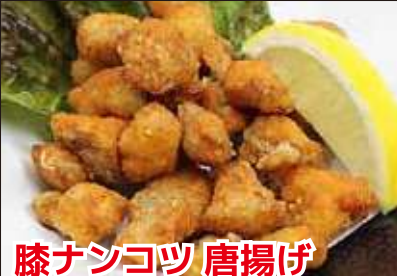
膝ナンコツ 唐揚げ