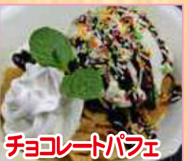
チョコレートパフェ