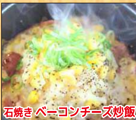
石焼きベーコンチーズ炒飯