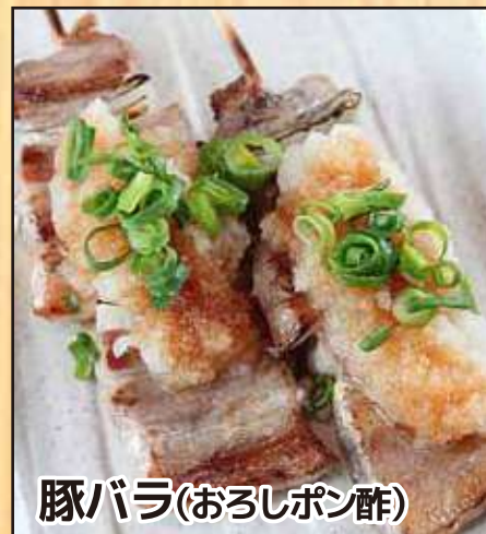
豚バラ (おろしポン酢)