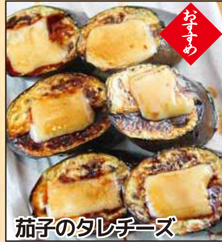
茄子のタレチーズ