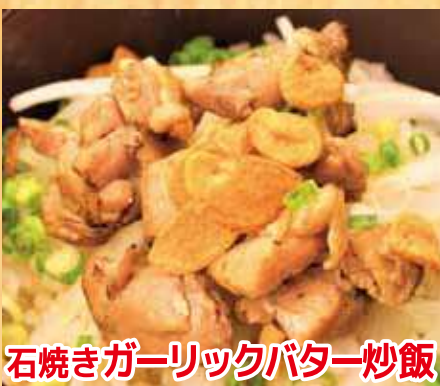
石焼きガーリックバター炒飯