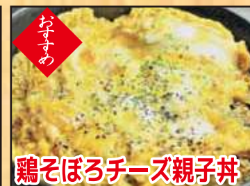
鶏そぼろチーズ親子丼