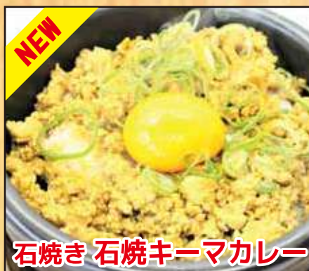
石焼き石焼キーマカレー