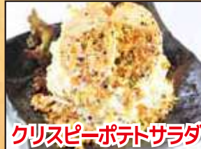
クリスピーポテトサラダ