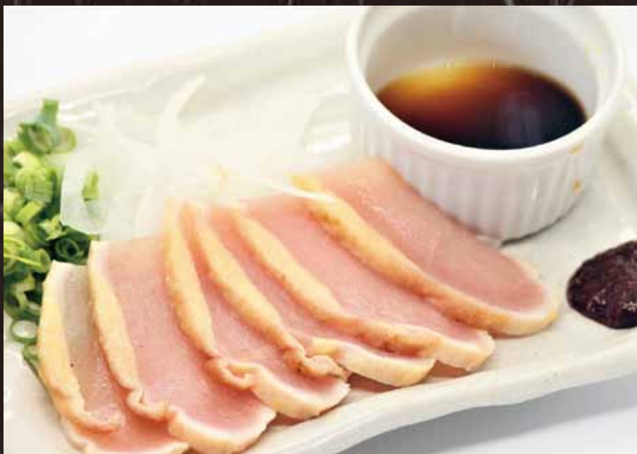
さつま知覧鶏たたき(特製ダレ) [1人前] 280 円(税込み308円)